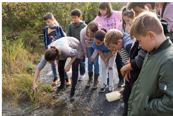
So ein Teich ist voller Leben

Arbeitseinsätze gab es nicht, leider ist im Schnepfenweiher zu wenig Wasser. In den letzten Jahren gibt es immer mehr Hitzeperioden.